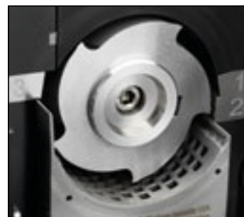
Минимальный мертвый объем для быстрой работы и очистки