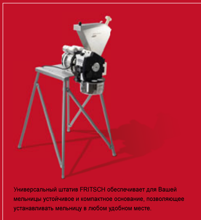
Универсальный штатив FRITSCH обеспечивает для Вашей мельницы устойчивое и компактное основание, позволяющее устанавливать мельницу в любом удобном месте.

Режущая мельница FRITSCH PULVERISETTE 15-это идеальная лабораторная режущая мельница для измельчения сухого материала с консистенцией от мягкого до среднетвердого, для волокнистых или целлюлозосодержащих материалов, а также для подготовки проб по стандартам RoHS и WEEE. С особо высоким числом оборотов режущего ротора в 2800 об/мин обеспечивает сильный поток воздуха и особо быстрое, воспроизводимое измельчение.