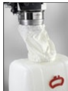
Приемный сосуд 60 л с рукавным фильтром