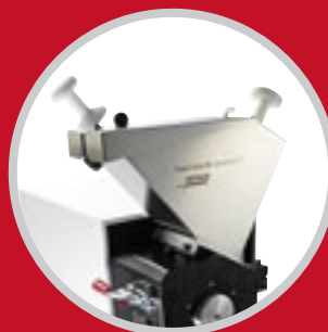
воронка с защитным слоем и толкателем, 3 литра

Для быстрой, простой и соответствующей типу материала загрузки в FRITSCH PULVERISETTE 25 Вы можете выбрать воронку из 2 предлагаемых моделей: для насыпного и сыпучего материала используйте стандартную воронку на 10 литров. Для всех других материалов используйте 3-литровую воронку с защитным слоем и толкателем.