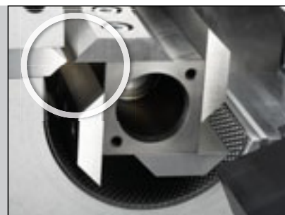
Особенно мощная резка: ротор Р-15 с прямыми лезвиями.