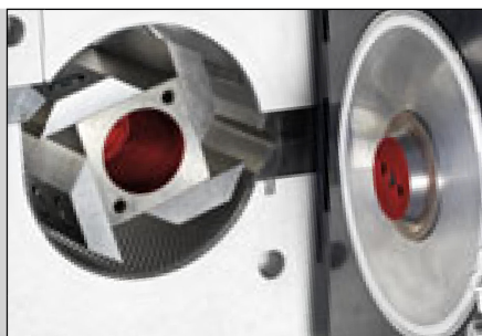
Особенно стабильная: ротор расположен на двойных подшипниках на валу и на дверце.

№ для заказа 400 В/3~ 230-240 В/1~ 100-120 В/1~ 15.4030.00 15.4020.00 15.4010.00