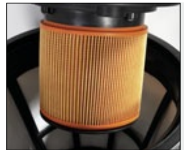
Циклон FRITSCH оснащен ультратонким воздушным фильтром HEPA.