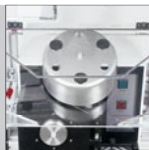
Автоматическое деление проб