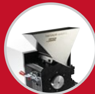
стандартная воронка для сыпучего материала, 10 литров